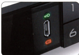
充電式バッテリーを搭載した環境に優しいデザイン